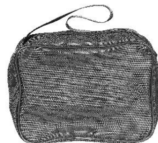
3- Bolsa de transporte