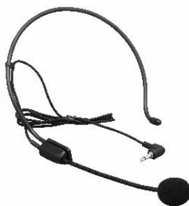
2- Micrófono diadema