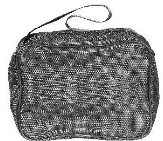
1. Main unit 2. Headset microphone 3. Carrying bag