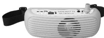
1- Unidad principal